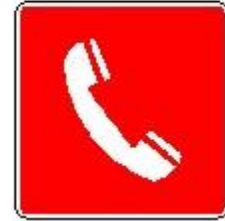
Telefono per interventi antincendio