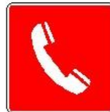
Telefono per interventi antincendio